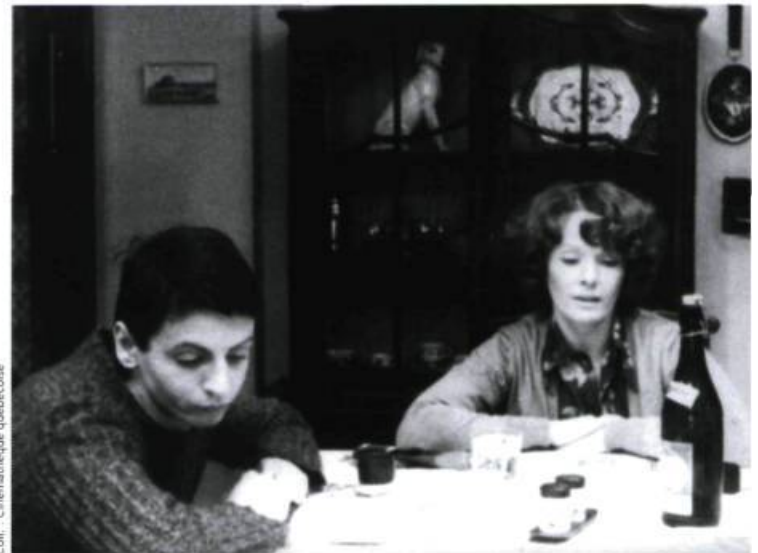
Jeanne Dielman (1976)

On me dit : « Pourquoi ne vas-tu pas en Espagne, là où crèvent des réfugiés africains ? » Je réponds que je l'ai déjà fait, ce film. L'Europe en ce sens ne diffère pas des États-Unis. L'histoire de James Byrd Jr, que j'aborde dans Sud , n'est pas tellement différente de ce qui se passe en Allemagne lorsqu'on met le feu à un refuge pour immigrés.