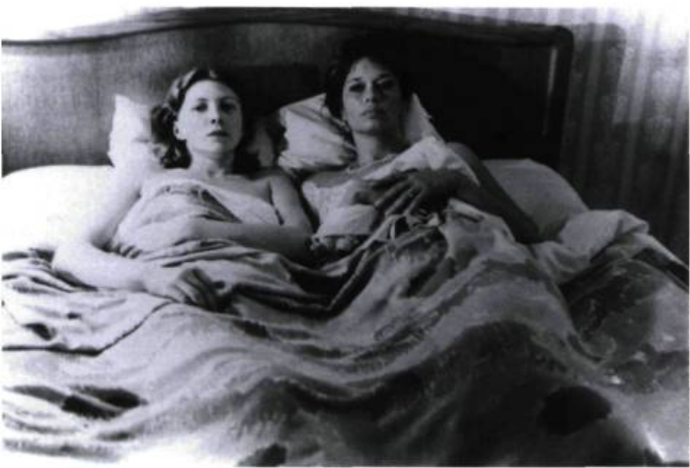
Call : Cinématique québécoise

Sans parler d'Israël, bien sûr. Il y a 2,5 millions de Juifs à New York sur environ 10 millions de gens. Et il y a quelque chose de communautaire dans cette ville – et aux États-Unis en général – que les Français reprochent beaucoup à l'Amérique, d'ailleurs. Il y a donc des poches juives un peu partout dans New York. Mais cette culture que j'appellerais yiddishisante , il n'en reste plus beaucoup par rapport à ce