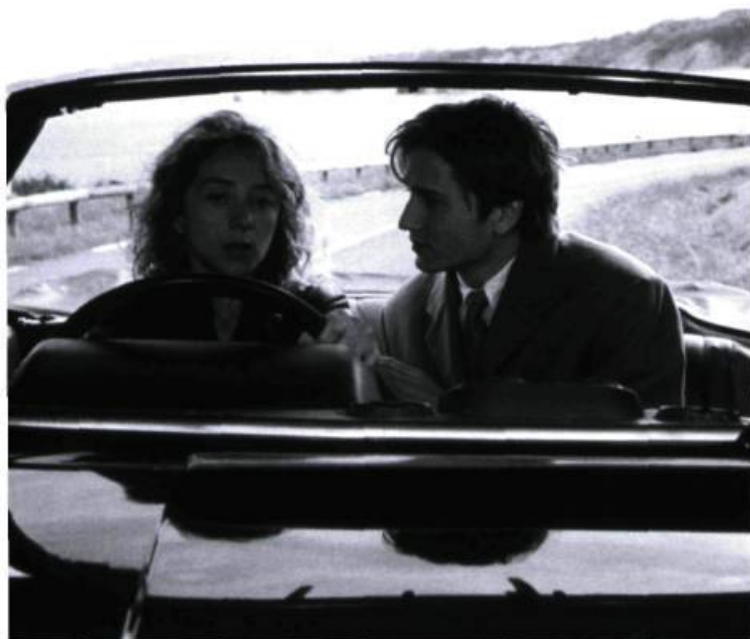
La captive (2000)

Il n'y a pas beaucoup de place pour cela. C'est-à-dire que ça dépend des films. Pour Toute une nuit , je n'avais que des petites notes : elle entre dans un café, s'assoit et deux verres tombent, etc. Et je ne savais pas non plus dans quel ordre tout cela allait se retrouver. Je savais comment je commencerais et je savais que l'orage aurait lieu à la fin de la nuit, mais entre les deux je ne savais pas. C'est au montage que tout s'est décidé.